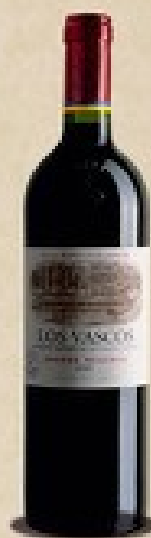
Los Vascos Grande Reserve