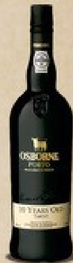
Osborne Young Port 15 YO

ALKOHOLA LIETOŠANAI IR NEGATĪVA IETEKME. TĀ PĀRDOŠANA, IEGĀDĀŠANĀS UN NODOŠANA NEPILNGADĪGĀM PERSONĀM IR AIZLIEGTA