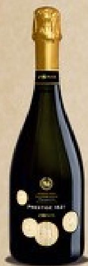
Zemlin Prosecco Valdībasdzirne D.O.M.G.