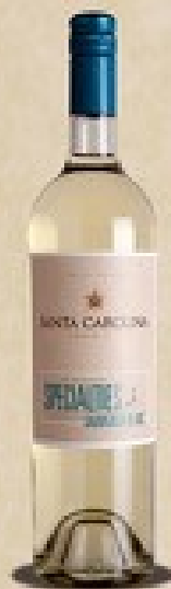
Santa Carolina Ocean Side Sauvignon