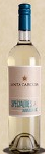
Santa Carolina Ocean Side Sauvignon