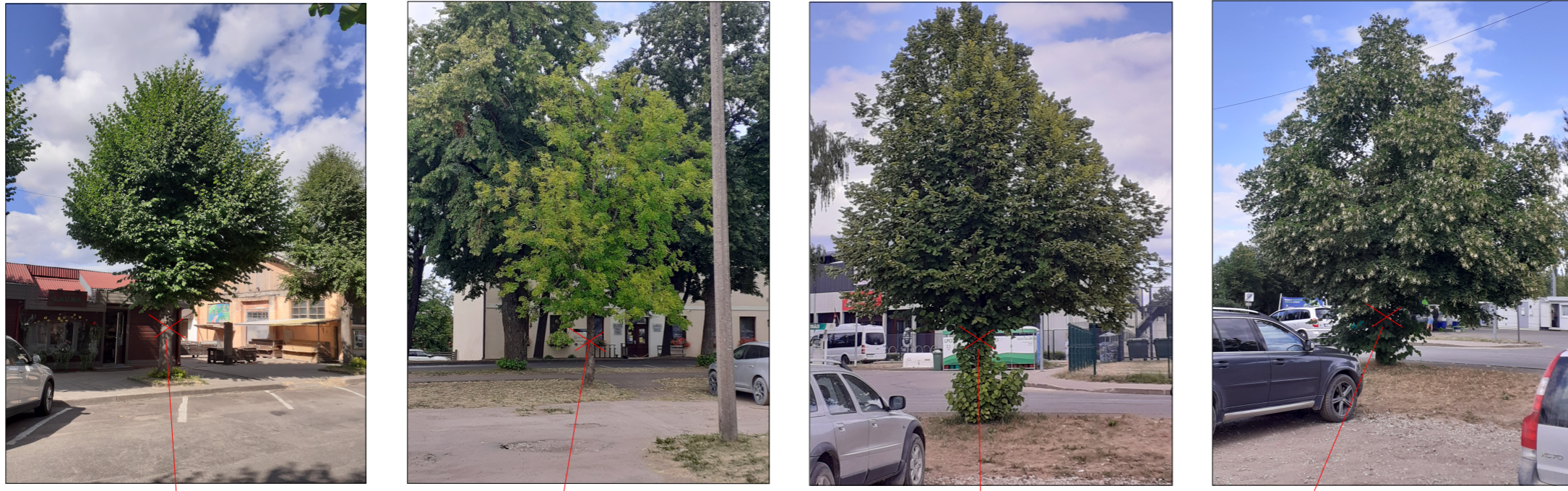
Objekta novietojuma plāns