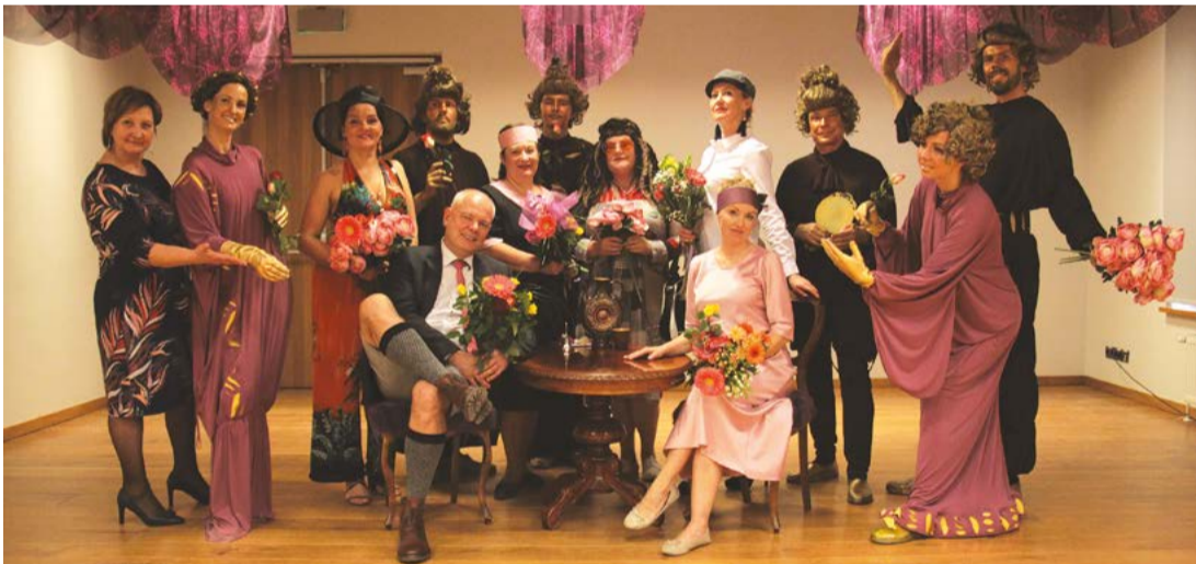
Attēlā: Cēsu teātris saviem skatītājiem piedāvā uzjautrinošu, pacilājošu, kaislībām un jautriem pārpratumiem bagātu teātra pavasari.

Cēsu teātris saviem skatītājiem pavasarī ir sagatavojis vairākus spilgtus notikumus. Pirmais no tiem – starptautiskajai teātra dienai veltīts koncerts “Esam mēs Cēsu zēni!” 27. martā plkst. 19.00 koncertzālē “Cēsis”.