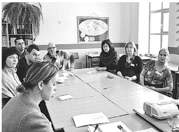
Attēlā: Izglītības darba grupa izstrādā priekšlikumus novada izglītības sistēmas uzlabošanai.

Forumā iesākumā dalībnieki varēja iesaistīties dažādu tēmu darba grupās: kultūra un izklaide, sports un aktīvā atpūta, tūrisms un pilsētas tēls, izglītība un karjera, vide (labiekārtojums, mājklojis), jauniešu iespējas. Darba grupu mērķis bija noteikt problēmas un prezentācijās piedāvāt risinājumus vai projektus konkrētajā tēmā. Pēc tam ikvienam bija iespēja nobalsot par viņaprāt veiksmīgākajiem risinājumiem.