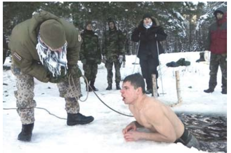
Attēlā: Jaunsargiem bija jāiztur arī tāds ekstremāls pārbaudījums kā mērķšanās āliņģī.