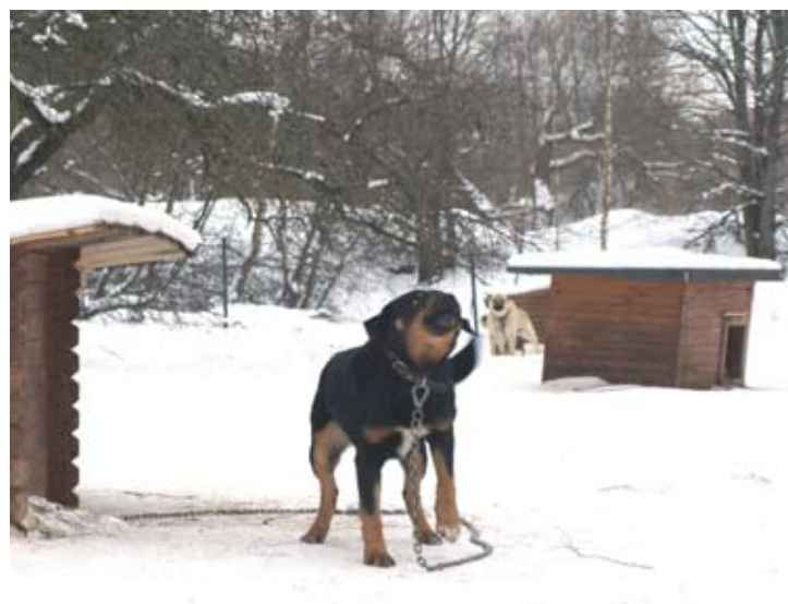
Attēlā: Kā redzams, patversmes iemītnieki nav mīļīgi klēpju sunīši.

Janvārī patversme bija pārpildīta. Diemžēl jāatzīst, ka daļa suņu saimnieku ir visai bezatbildīgi un pieļauj, ka suns regulāri klejo. Jāatgādina, ka par suņa uzturēšanos patversmē tā saimniekam ir jāmaksā. Tāpēc, ja četrkājainais draugs pazūd, nevajadzētu gaidīt, kad suns pats atgriezīsies no brīvsoļa, bet tomēr to meklēt..,