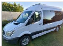
Mercedes Sprinter 9500 €