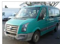
Volkswagen Crafter 9990 €