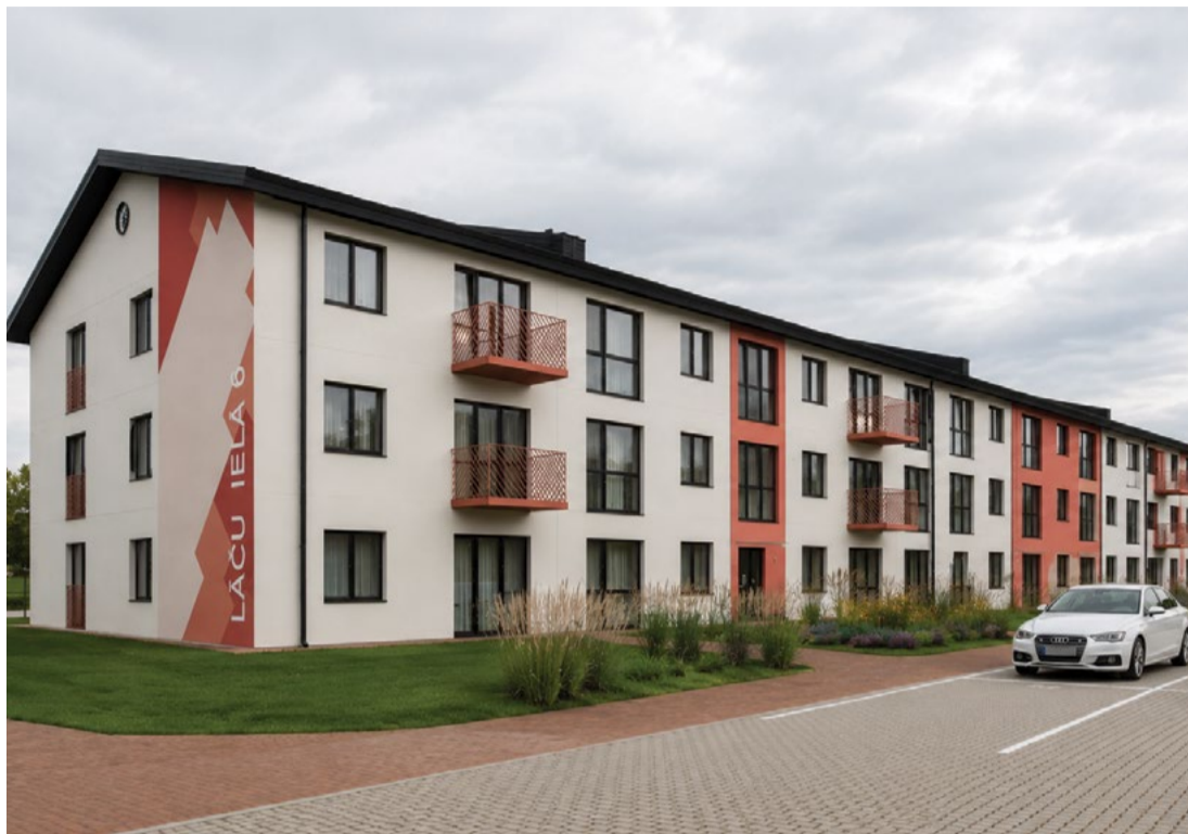
Vizualizācijā: Trīsstāvu ēkā Lāču ielā būs 56 dzīvokļi – studio tipa, divistabu un trīsistabu dzīvokļi ar pilnu iekšējo apdari un iebūvētu virtuves iekārtu.

Sākusies pieteikšanās zemas ires maksas dzīvokļiem jaunajā dzīvojamajā mājā Lāču ielā 9, Cēsis. Jaunais projekts sniegs iespēju novadā dzīvesvietu atrast speciālistiem, ģimenēm un citām mājāsaimniecībām, kurām nepieciešams mūsdienīgs un pieejams mājoklis. Trīs stāvu ēkā būs 56 dzīvokļi – studio tipa, divistabu un trīsistabu dzīvokļi ar pilnu iekšējo apdari un iebūvētu virtuves iekārtu. Pie ēkas tiks izveidota labiekārtota teritorija, autostāvvietas un velosipēdu novietnes. Mājas nodošana ekspluatācijā plānota 2026. gada jūlijā.