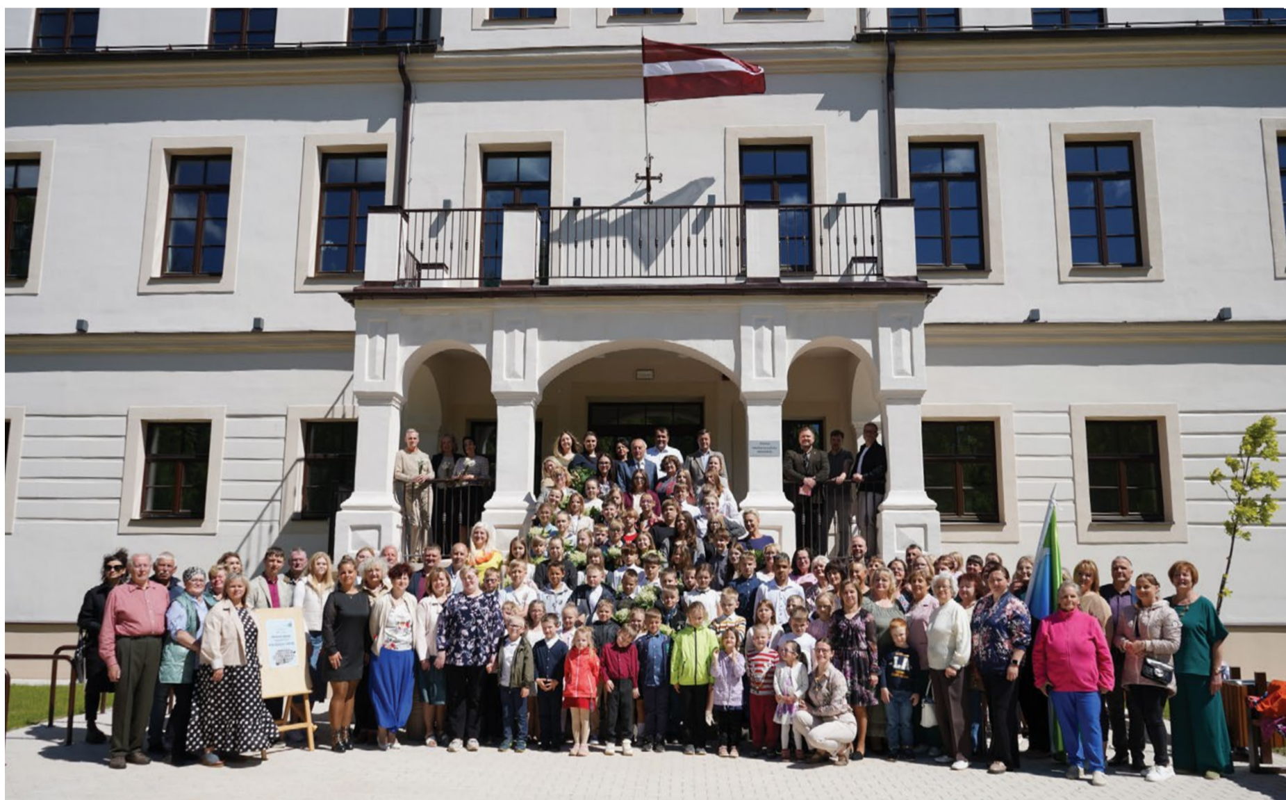
Attēlā: Atjaunotajā Nītaures mūzikas un mākslas pamatskolā vasarā vēl paredzēta mēbeļu un telpu aprīkojuma montāža, bet 1. septembrī bērnu darza un skolas kolektīvs sāks mācības atdzimušajā muižas ēkā.

Otrdien, 26. maijā, svinīgi atklāta pārbūvētā Nītaures mūzikas un mākslas pamatskola. Atklāšanas pasākuma laikā ikvienam interesentam bija iespēja klātienē iepazīties ar pārbūves projektā paveiktajiem darbiem, kā arī uzzināt vairāk par projekta īstenošanas gaitu.