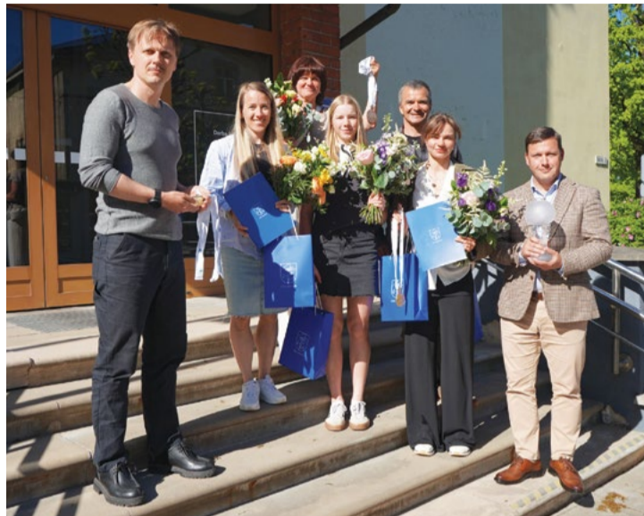
Attēlā: Pēc izcili aizvadītas sezonas Cēsu un Latvijas spēcīgākās biatlonistes un viņu trenerus godināja pieņemšanā pie Cēsu novada domes priekšsēdētāja.