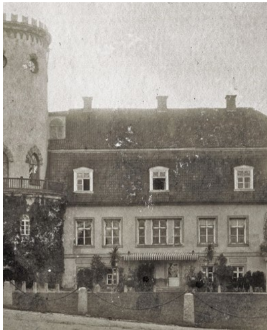
Attēlā: Eksotiskas augu dekorācijas pie Jaunās pils 19. gadsimtā un tagad.

Iedvesmojoties no vēsturiskās fotogrāfijas, Cēsu muzejs svētku dienās apmeklētājiem piedāvāja baudīt 19.–20. gs. mijā iekštelpu un ārtelpu