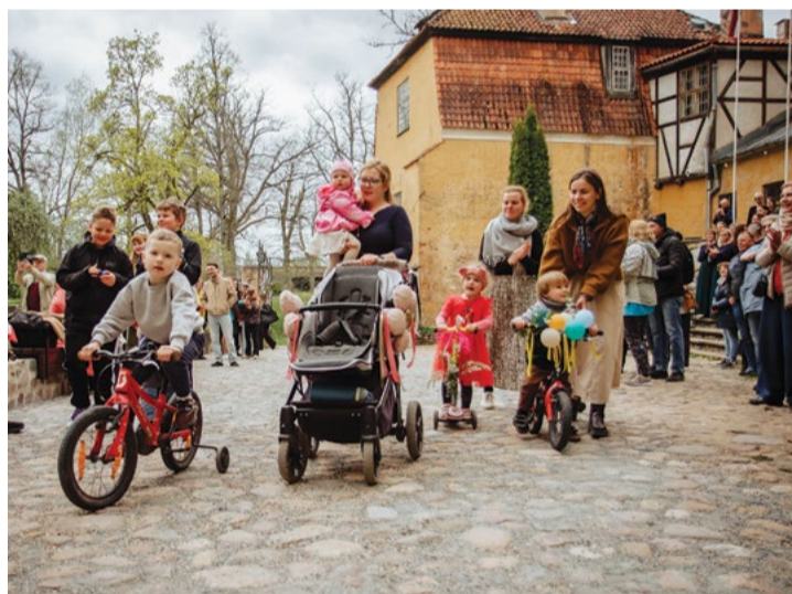
Attēlā: Izrotātu bērnu ratiņu un citu braucamrīku parāde atjaunotā iekšpagalma atklāšanas pasākumā, demonstrējot, ka iekšpagalma bruģa segums ir kļuvis apmeklētājiem draudzīgāks.

Labiekārtošanas darbi īstenoti projekta “Dārza Pērles ikvienam” ietvaros ar Interreg Igaunijas–Latvijas pārrobežu sadarbības programmas 2021–2027 līdzfinansējumu. Projekta kopējās izmaksas ir 34 850