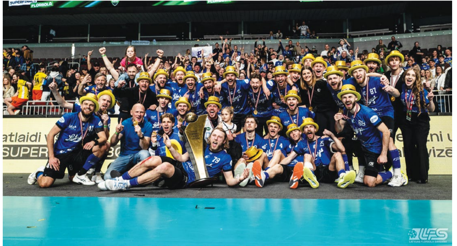
Attēlā: Izšķirošajā spēlē pārliecinoši pārspējot regulārā turnīra uzvarētājus “Masters Ulbroka”/“Latvijas Universitāte”, Cēsu “Lekrings” florbola komanda devīto reizi kļuva par Latvijas čempioniem.

Izšķirošajā finālspēlē “Lekrings” ar disciplinētu un sīkstu aizsardzību veiksmīgi slāpēja pretinieku individuālos centienus, liekot tiem nervozēt. Otrās trešdaļas sākumā rezultāts vēl bija neizšķirts – 2:2, taču tad cēsnieki veica iespaidīgu izrāvienu, gūstot trīs vārtus. Pēdējās minūtes Ulbrokas komanda vārtsargu nomainīja pret sesto spēlētāju, turklāt 45 sekundes pirms pamatlaika beigām “Lekrings” nonāca mazākumā. Taču ar to “Masters Ulbroka”/“Latvijas Universitāte” nepietika, lai atspēlētos. Labākā spēlētāja balvu “Lekrings” rindās