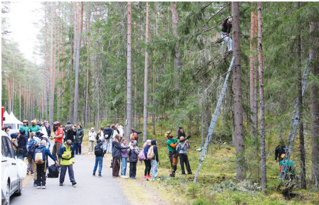
Attēlā: Meža dienu pieturā "Pastaiga pa koku galotnēm" varēja vērot mežu no vāveru un putnu skatupunkta.

Slēpošanas un biatlona centra "Cēsis" teritorijā 24. aprīlī norisinājās Cēsu novada Priekuļu apvienības pārvaldes organizētais tradicionālais Meža dienas pasākums "Nāc līdzī, ejam mežā!".