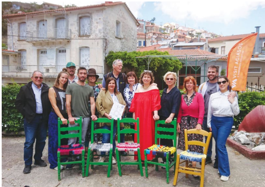
Attēlā: Projekta laikā Grieķijā, Lesbas salā, uzmanība tika pievērsta tradicionālajai amatniecībai – grozu un krēslu pišanai, apvienojot to ar materiālu atkārtotu izmantošanu.

Īpaša nozīme bija Cēsu Mākslas skolas pedagogu vadītajai meistarklasei, kur dalībnieki apguva gleznošanu ar dabas materiāliem. Tika iegūti pigmenti no zemes, augiem un citiem vietējiem resursiem, kas vēlāk izmantoti radošajos darbos.