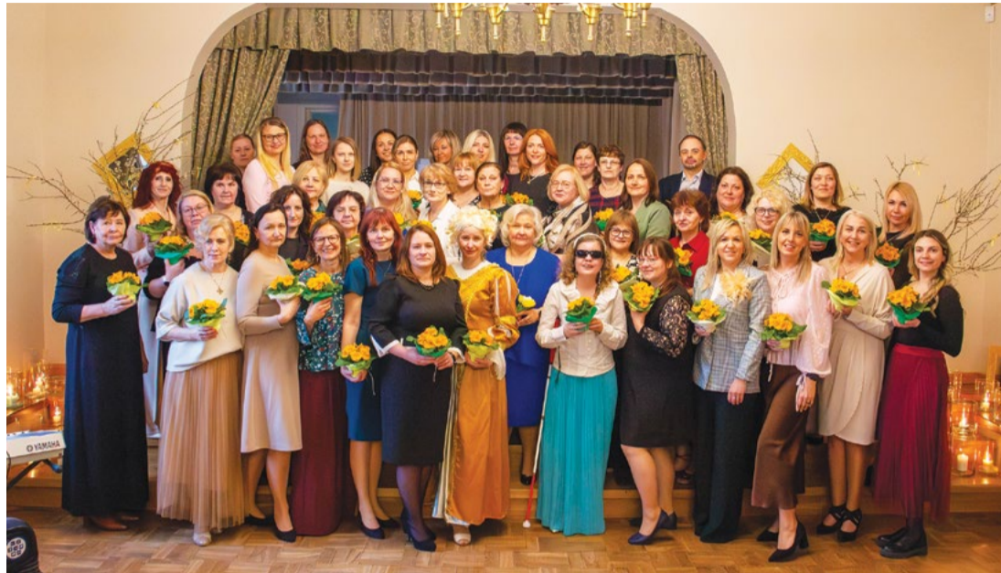
Attēlā: Pasaules sociālā darba dienā novada sociālā dienesta darbinieki godināja kolēģu ieguldījumu, pašiniciatīvu un labos darbus.

Starptautiskās sociālo darbinieku federācijas (IFSW) šī gada tēma akcentē sociālā darba nozīmi sabiedrības ilgtspējīgā attīstībā un cilvēku