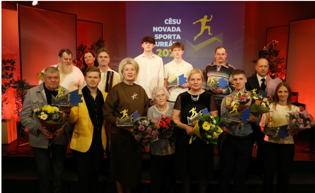
Attēlā: Novada sporta izcilnieki saņēmuši balvas par pagājušā gada sasniegumiem komandu un individuālajos sporta veidos.

Martā radošajā kvartālā "Zeit", Līgatnē, sveicām šī gada izcilākos sportistus, trenerus, komandas un sporta notikumu veidotājus.