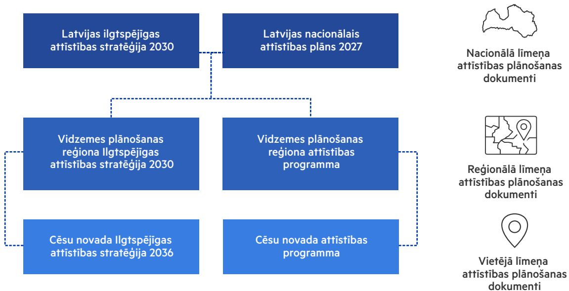
Attēls Nr.1. Plānošanas dokumentu hierarhija