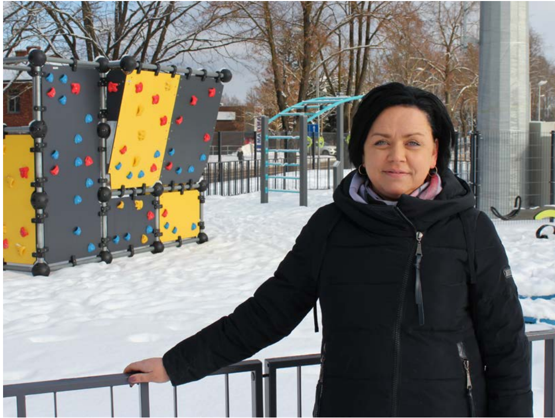
Attēlā: Sportiskas atpūtas cienītāji atjaunotajā stadionā var kārtīgi izslēpoties, pirms tam rūpīgi iesildoties trenāžieru laukumā.

“Kolīdz iestājās noturīgs sals, un varēja sākt slidot, saņēmu daudz zvanu ar jautājumu, kur Cēsīs var izīrēt slidas? Aukstas un sniegotas ziemas pēdējos gados ir retums, pirt sporta inventāru, nezinot vai to izdosies likt lietā, nav prātīgi, tāpēc slēpju un slidu nomas punkts ir vajadzīgs. Atjaunotajā stadionā tādu būs