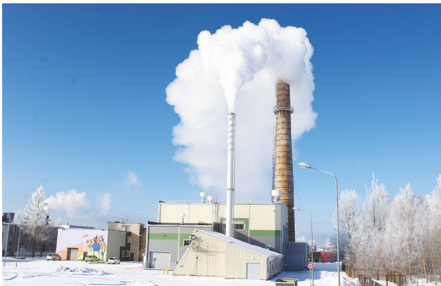
Attēlā: Laika vērotāji Cēsīs labi zina, ja kūp abi Cēsu siltumtīkļu centrālās katlu mājas dūmeņi, būs bargā ziema.

"Aukstajās februāra dienās siltuma ražošanai izmantojam visas centrālās katlu mājas siltumenerģijas ražošanas iekārtas. Siltuma jaudas rezerve vēl ir, taču darba ritms uzņēmumā kļuvis krietni spraigāks. Pastiprināti uzraugām Cēsu siltumapgādes sistēmas darbību, lai negadītos nepatīkami pārsteigumi. Protams, gatavojoties sezonai, rūpīgi pārbaudījām siltuma ražošanas un pārvades sistēmas, kā arī novērsām atklātās nepilnības. Taču apkures sezona ir gara, un, ja sals ir pamatīgs, jābūt dubultā uzmanīgiem – īpaši naktīs. Bez centrālās katlu mājas Cēsīs