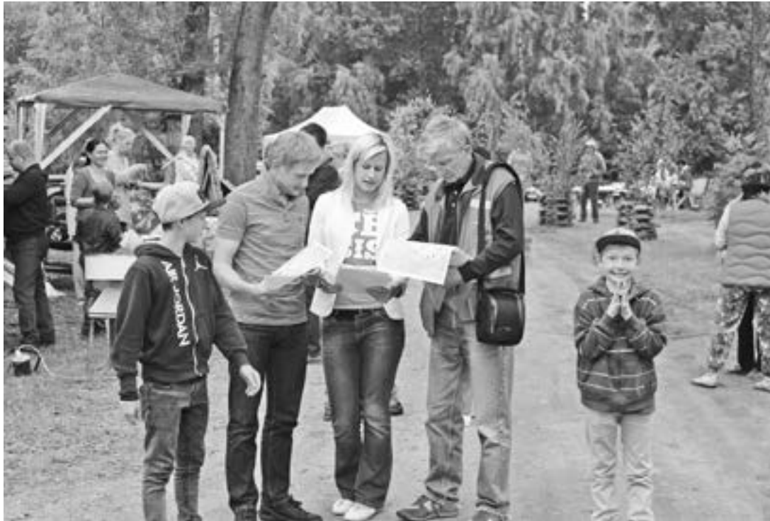
Attēlā: Lai sekmīgi startētu autoorientēšanās sacensībās, vispirms jāizpēta karte un jāsaprot, kur Vaivē ir Ziemeļi un kur - Dienvidi.

varēs piedalīties Vaives sporta spēlēs. Tās būs netradicionālas sacensības, uz ko norāda jau aktivitāšu nosaukumi – būris, frīzbijgolfs, zirneklis, florbola siers un peļu alas. Varēs sacensties arī meitu vecākiem ierastā disciplīnā – bižu pīšanā.