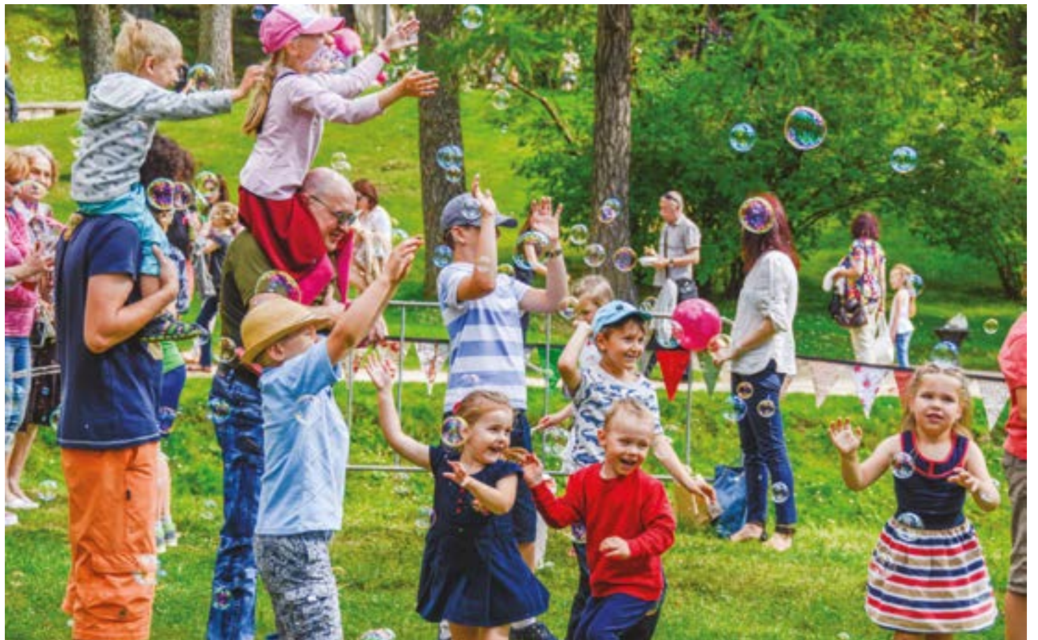
Attēlā: Neviltots prieks un labs noskaņojums bija lielu un mazu Cēsu svētku apmeklētāju drošs pavadonis.

Savukārt jau ceturto gadu Cēsis divu dienu garumā norisinājās bezmaksas rok-mūzikas festivāls “Fono Cēsis”, kas arī šogad pulcējis vairākus desmitus tūkstošu cilvēku. Festivālā piedalījās gan populāri pašmāju izpildītāji, to skaitā “Franco Franco”, “Dzelzs Vilks”, “Satellites LV”, “Edavārdi”,