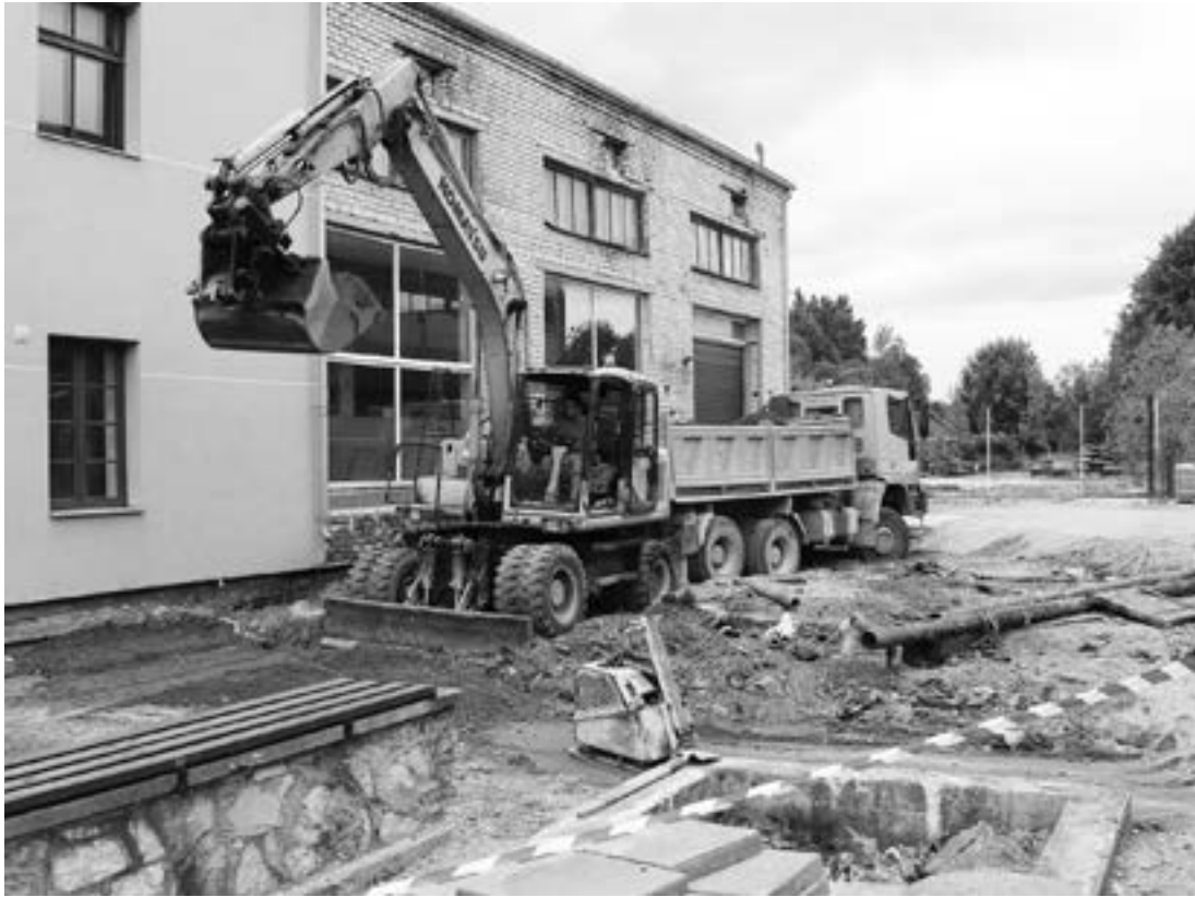
Attēlā: Saulrītu ielā ir izbūvēti pazemes tīkli un uzklāta pirmā cietā seguma kārtā. Celtnieki jau sākuši ietvju būvniecību un labiekārtošanas darbus.

Šovasar turpinās pilsētas grants ielu apstrāde ar divkārtšo segumu, kas ievērojami uzlabo ielu funkcionalitāti un arī dzīves vidi apkārtējo namu iedzīvotājiem.