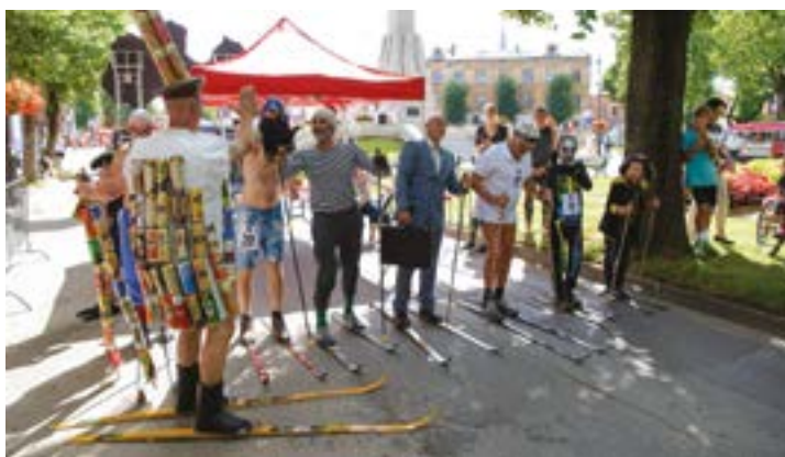
↑ Attēlā: Vasaras slēpošanas sprints tradicionāli izcēlās ar tā dalībnieku fantāzijas lidojumu tērpu izvēlē.