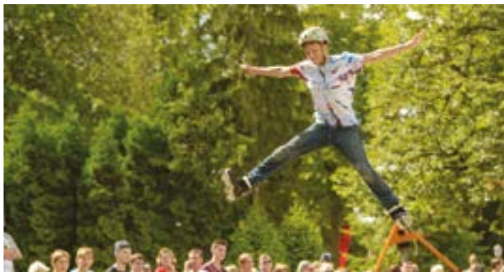
↓ Attēlā: Bet reālus lidojumus galvu reibinošā augstumā demonstrēja "Dynamit Jam" jaunie adrenalīna mednieki.