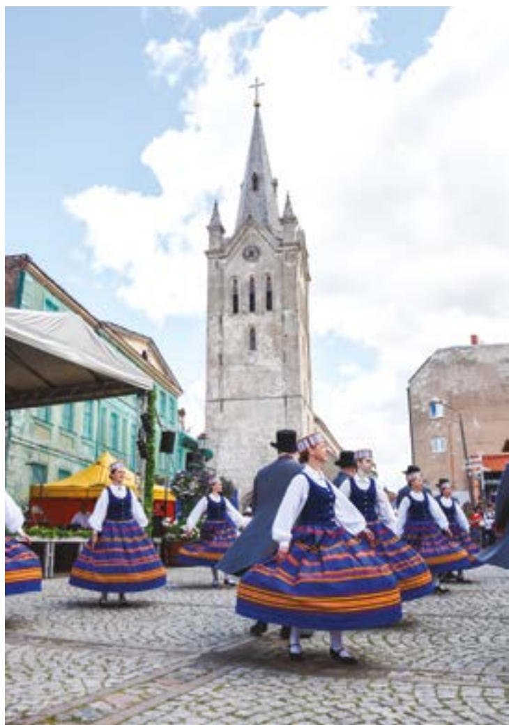
↑ Attēlā: Rožu laukumā pūtēji saviļņoja gaisu, bet dejotāju soļu raksti saviļņoja skatītāju sirdis.